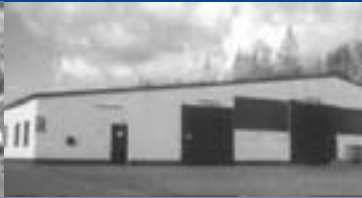
Werk Heretsried / Composites Plant Heretsried / Composites