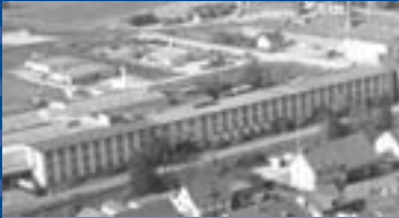
Hauptsitz & Produktion Erzingen Headoffice & Production Erzingen