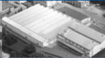
Werk Hlinsko Production Hlinsko