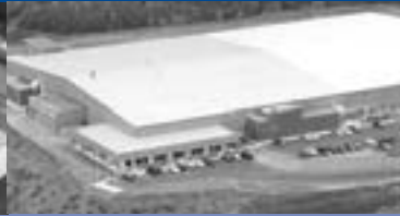
Verkaufsbüro Nordamerika Sales Office North America

Synteen & Lückenhaus Textil-Technologie GmbH Robert-Stehli-Strasse 8 79771 Klettgau-Erzingen, Germany