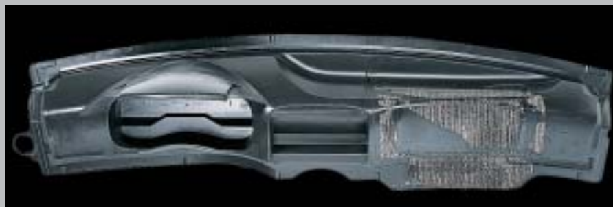
Dashboard Airbag covers