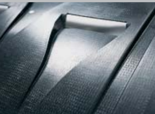
Under body shielding Fragment protection